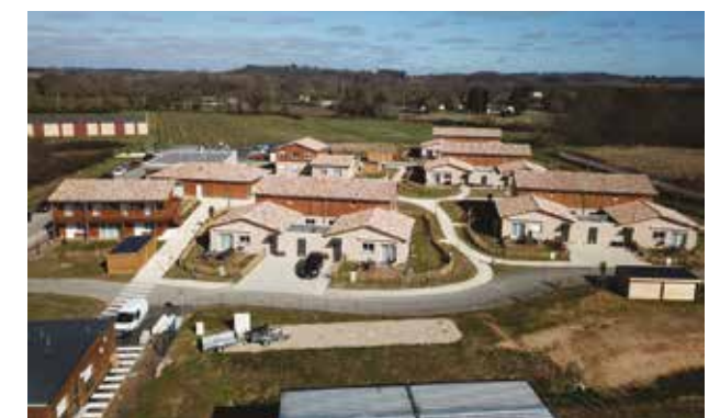
Le village d'enfants et d'adolescents de Sablon-sur-Gironde