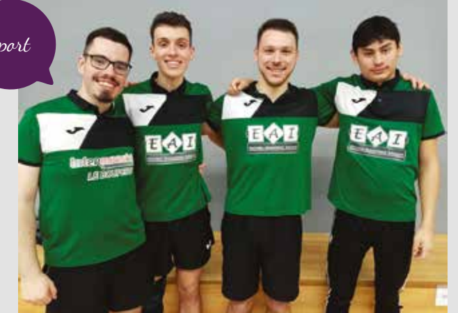
4 des 5 joueurs de l'équipe de Régionale 3