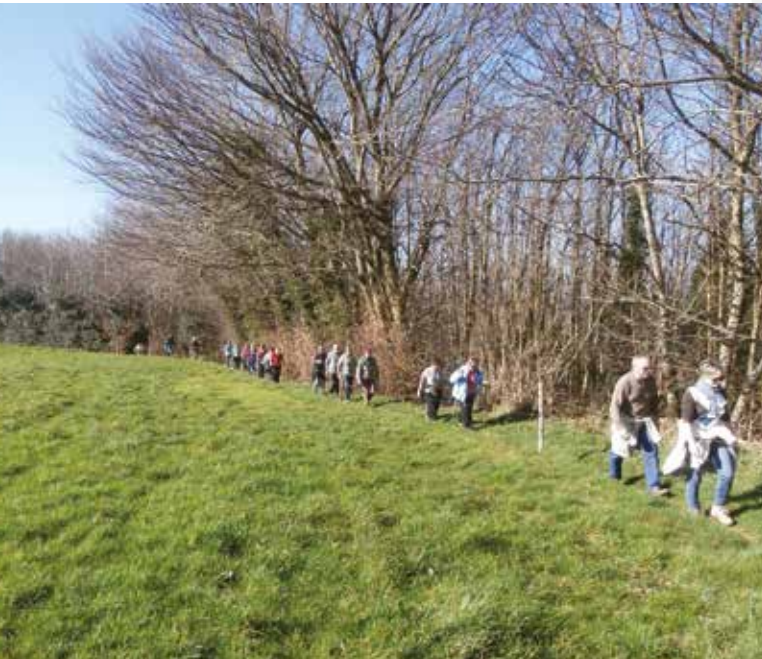
La randonnée La Culminante a lieu chaque année le premier dimanche de novembre

Dans nos bourgs ou à travers nos villages, Sèvremont a la chance de disposer d'un joli réseau de sentiers, pour faire des petites promenades ou de plus grandes randonnées... Connaissez-vous tous leurs secrets ?