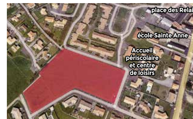
Le village s'installera sur un terrain de 10.000 m 2 dans le centre de Saint-Michel-Mont-Mercure

Marc CHABANT : L'objectif est de permettre aux enfants de faire leur rentrée scolaire en septembre 2025 dans leurs maisons définitives. En amont, un an avant l'ouverture, la Fondation Action Enfance travaillera avec le Conseil Départemental sur l'admission des enfants dans le village, pour préparer au mieux leur arrivée dans la commune : inscription scolaire, activités de loisirs... Parallèlement, elle mènera une campagne de recrutement pour l'embauche des éducateurs familiaux et des équipes administrative et technique qui viendront partager le quotidien des enfants.