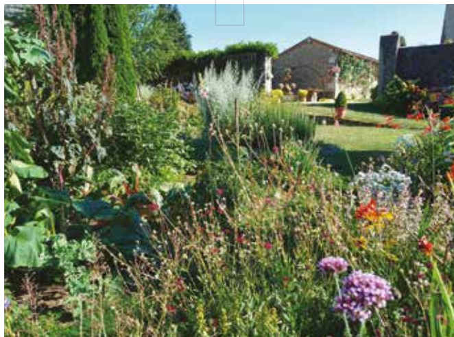
Photographie du jardin des Carmes de Bernard VINCEDEAU à La Flocellière