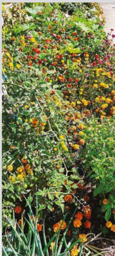
dans son potager à Les Châtelliers-Châteaumur