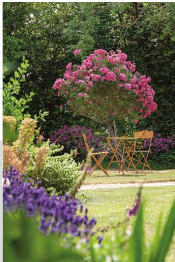
Photographie prise par Jean-Pierre PIGNON dans son jardin à Saint-Michel-Mont-Mercure