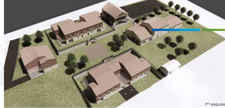
7 ème esquisse