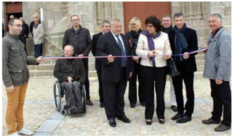
▲ L'église de Saint-Michel-Mont-Mercure inaugurée en 2015 après un vaste chantier de travaux