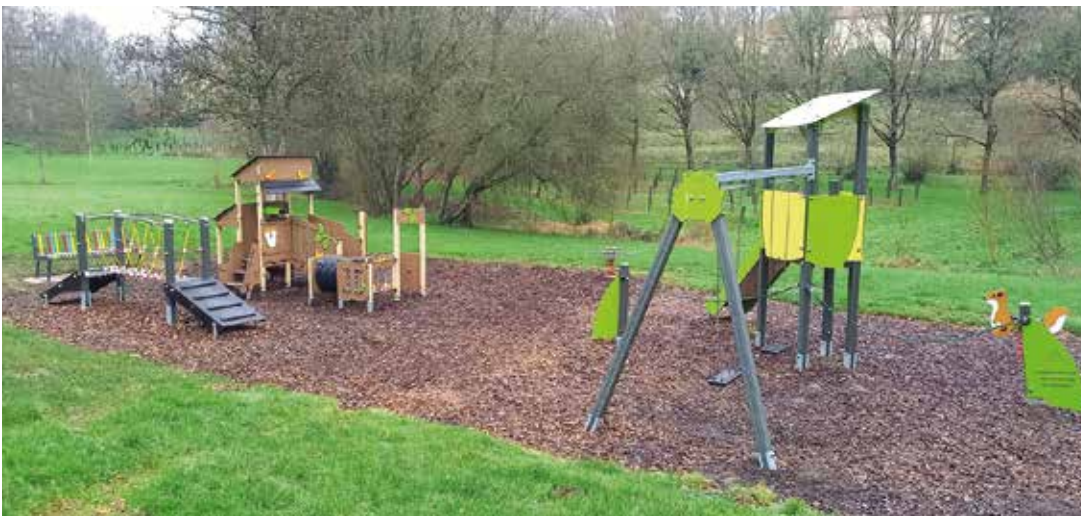
L'un des deux projets 2024 retenus, la mise en place d'une structure de jeux extérieurs adaptés aux enfants de moins de 3 ans au parc des Lavandières, sur la commune déléguée de Les Châtelliers-Châteaumur, a été inauguré le 28 mars dernier.