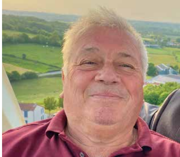
En 2022, dans la grande roue à Les Châtelliers-Châteaumur