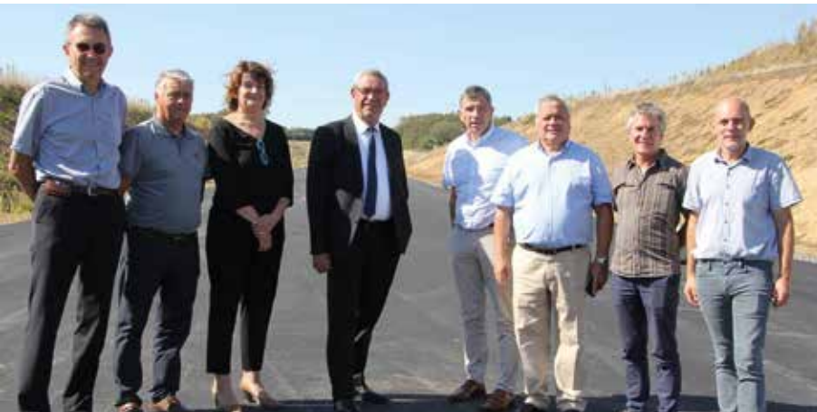
Sur le chantier du contournement de Saint-Mercure-Mont-Mercure, achevé en 2021 ◀