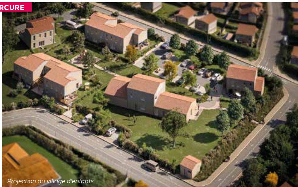
Projection du village d'enfants

Le chantier a démarré en février, pour une ouverture prévue à l'été 2026. Deux entreprises de Sèvremont ont été retenues pour y intervenir : Soléa Design et GUICHETEAU Groupe. Le directeur du village d'enfants vient récemment d'être nommé, une personne qui a emménagé à Sèvremont et qui dirigera également le 2 ème village d'enfants de Vendée, situé à La Génétouze.