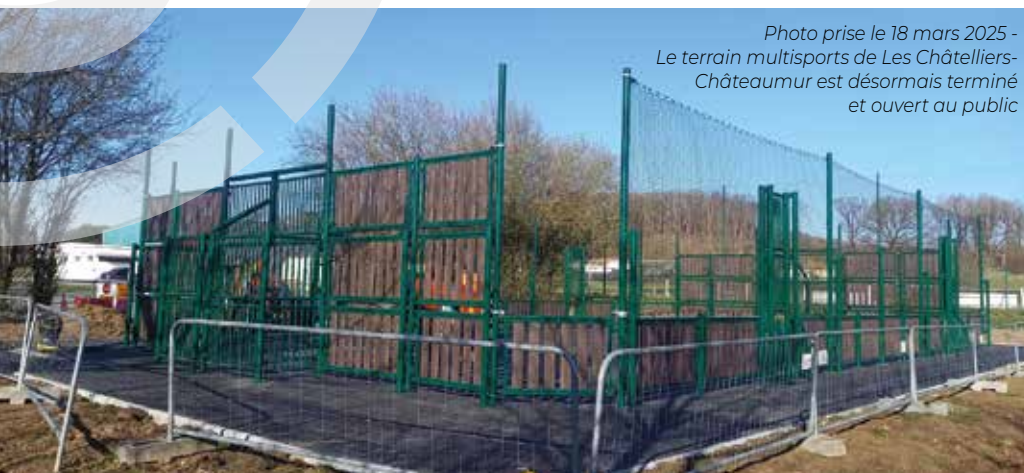
Photo prise le 18 mars 2025 - Le terrain multisports de Les Châtelliers-Châteaumur est désormais terminé et ouvert au public

*Une station BoxUp permet de rendre le matériel de sport et de loisir accessible à toutes et tous. Il suffit de télécharger une application sur son smartphone, choisir un casier disponible contenant un jeu (ex. : des boules de pétanque, un ballon de basket, des jeux de société...). Le matériel est mis gratuitement à disposition de la population pour 3h maximum. Pour restituer le matériel, il convient de prendre une photo de l'équipement remis dans le casier à travers la vitre transparente et de la poster sur l'application.