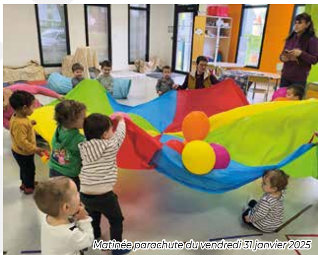
Matinée parachute du vendredi 31 janvier 2025

Nous sommes également à la recherche de nouveaux bénévoles afin d'enrichir notre équipe, apporter des idées nouvelles et développer encore