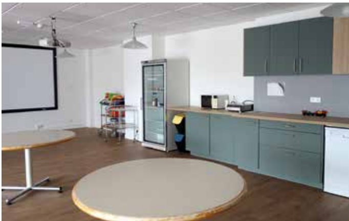
Le salon des Lilas est adapté aux résidents les plus dépendants : ils y prennent leurs repas le midi et le soir, aidés par du personnel qualifié. Ils peuvent également s'y réunir pour des activités variées.