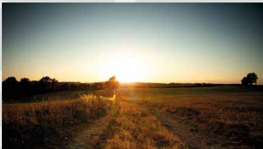
sur un chemin entre La Mongie et Brie - commune déléguée de La Pommeraie-sur-Sèvre