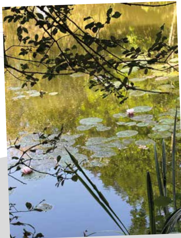
sur le sentier du Château - commune déléguée de La Flocellière