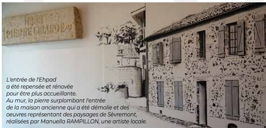
L'entrée de l'Ehpad a été repensée et rénovée pour être plus accueillante. Au mur, la pierre surplombant l'entrée de la maison ancienne qui a été démolie et des oeuvres représentant des paysages de Sèvremont, réalisées par Manuella RAMPILLON, une artiste locale.

Les travaux qui viennent de s'achever il y a quelques semaines ont commencé à être imaginés dès 2012 : une partie du bâtiment n'était plus aux normes, certaines chambres n'avaient pas de douche... En 2017, un programme de travaux a été rédigé, validé en 2018, puis la crise sanitaire est arrivée et le chantier n'a pas pu démarrer avant 2021. La proximité du château de La Flocellière et de la chapelle de Lorette a imposé des contraintes de la part des Architectes des Bâtiments de France. Quatre ans plus tard, les travaux de mise aux normes, d'extension et d'embellissement sont terminés ! Découvrez en images les principales nouveautés.