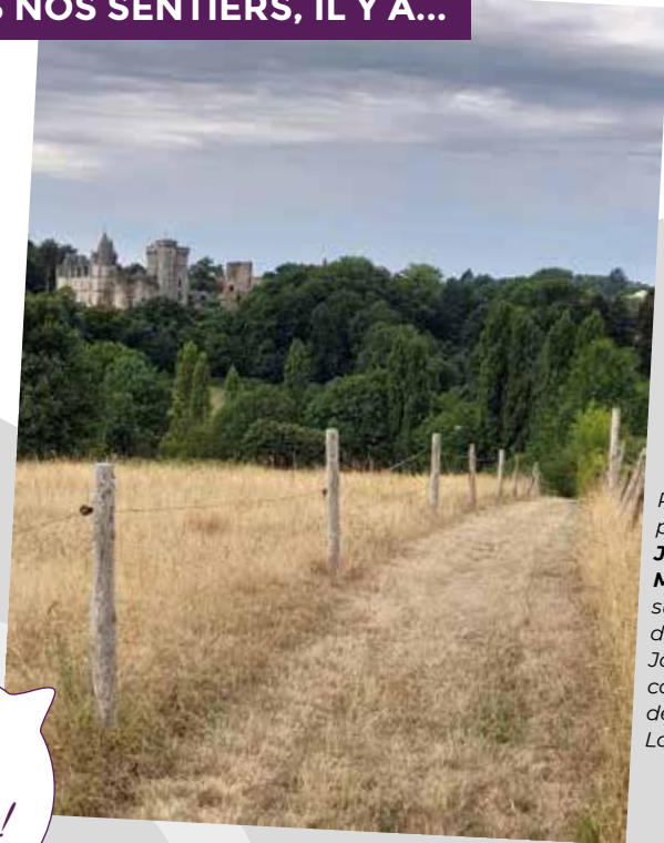
sur le sentier du Moulin de la Jaubretière - commune déléguée de La Flocellière