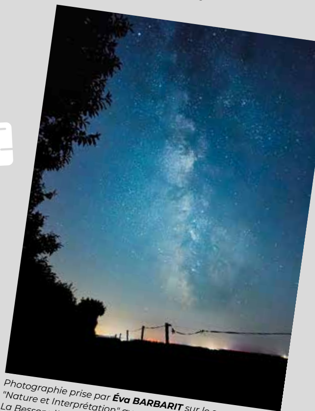
sur le sentier "Nature et Interprétation" avant la descente vers La Bessonnère - commune déléguée de Saint-Michel-Mont-Mercure