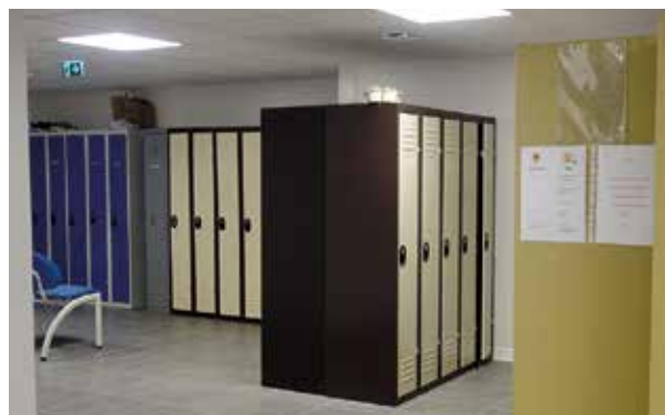
Les membres du personnel bénéficient de vestiaires spacieux et adaptés, équipés de casiers, de sanitaires et de douches.