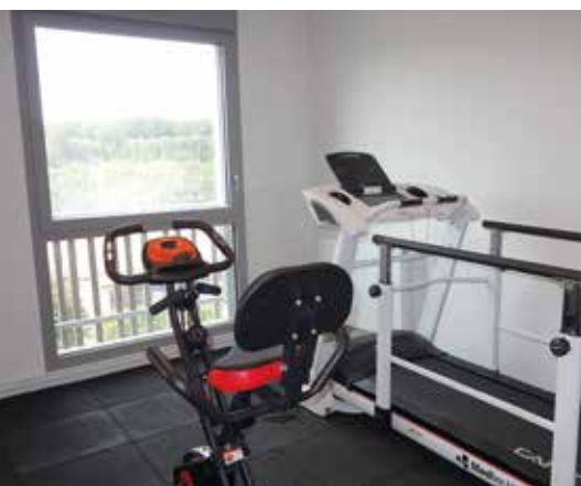
Une salle de sports est désormais à la disposition des résidents et du personnel, bénéficiant d'une magnifique vue sur la campagne environnante. Cette idée d'agents de l'Ehpad a été plebiscitée par les habitants dans le cadre du Budget Participatif de la commune, qui a financé les équipements. À terme, elle pourra être ouverte aux habitants.