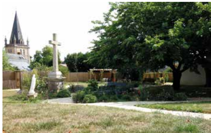
L'acquisition d'un terrain limitrophe a permis l'agrandissement du jardin. Il a été aménagé avec du gazon, des fleurs, des poules, des tables et chaises de jardin... Cet espace est désormais un véritable lieu de vie apprécié des résidents.