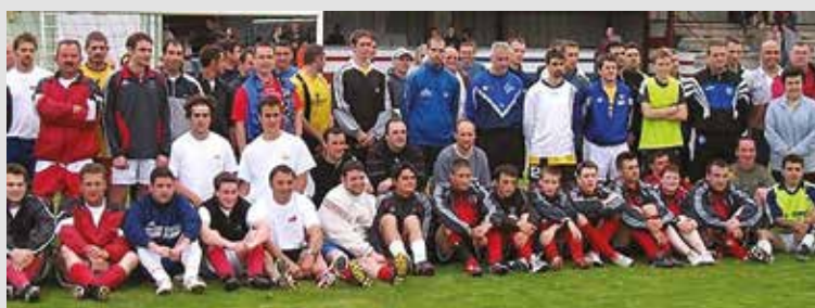
Photo souvenir du tournoi 2007

C'est ainsi qu'en juillet dernier, une cinquantaine de joueurs se sont affrontés, issus des entreprises Rantière Bâtiment, Bocage Bière Boissons, Aux Saveurs de Tom, Webasto, Benaiteau, Maison Patrick Moreau, Soléa Design, FB Déco'styl et Pasquier SARL, ainsi que des adhérents de l'association Castelmurois Ambiance Sportive.