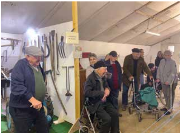
Visite de la ferme de La Bretonnière

23 septembre - Visite de la ferme de La Bretonnière : outils et engins agricoles, école d'autrefois, objets ménagers. Toujours un plaisir de partager nos souvenirs de l'ancien temps.