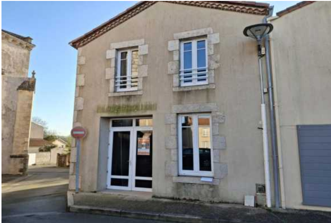
La solution technique est déterminée dans le respect de la norme NFC 14-100 en vigueur. Photo compteur non contractuelle